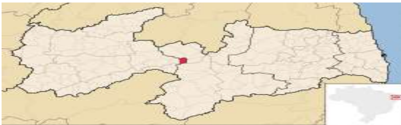
Quadro I - Regiões de Saúde do Estado da Paraíba