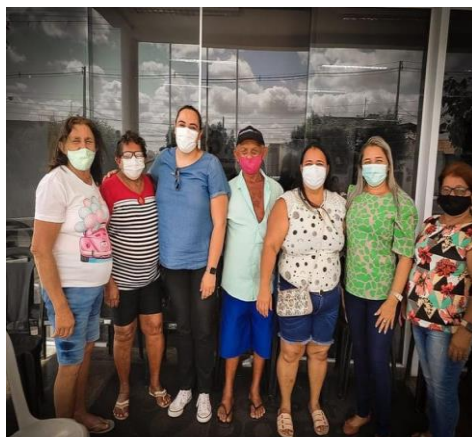
CIRURGIAS DE CATARATA – HOSPITAL DO BEM