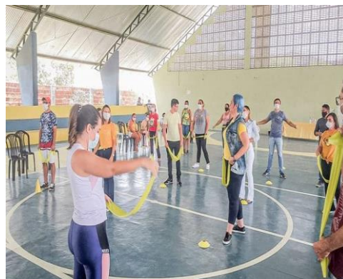
AÇÃO SETEMBRO AMARELO